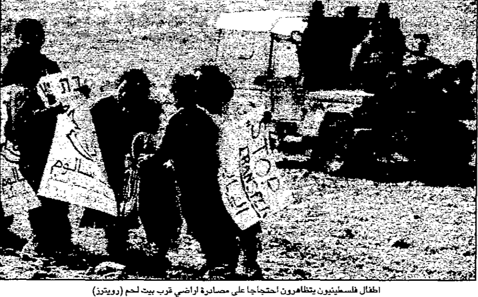
اطفال فلسطينيون يتظاهرون احتجاجا على صنادير اراضي قرب بيت لحم

لندن - القدس العربي: ذكرت اسبوعية «الجوش كرونكل» اليهودية البريطانية ان ولي العهد البريطاني الامير تشارلز سيسجل اول زيارة رسمية له الى القدس في نيسان المقبل للمشاركة في مراسم يهودية بمناسبة الذكرى الخمسين لتأسيس الدولة العبرية. وقالت الصحيفة ان ايليانا ليفي رئيس مجلس اتحاد السفراء في لندن سيحضر مراسم متحف اسبوع في القدس من اجل استقباله في القدس من قبل رئيس بلدية القدس جوسوف ووت في لندن. وذلك ضمن احتفالات الجالية اليهودية البريطانية بالذكرى الخمسين لتأسيس اسرائيل في شهر نيسان (ابريل) المقبل. وقال ليفي ان هذه المراسم ستتمثل الاحتفالات الدولية الرئيسية للجالية اليهودية بهذه المناسبة. والتي سيشترك فيها ممثلون عن اليهود الاسبان والبريطانيين. وهذه اول مرة يشارك فيها افراد في العائلة البريطانية المالكة باحتفالات دينية يهودية داخل القدس. وكانت الجالية اليهودية حاربت دعوة الملكة اليزابيث الثانية لحضور مراسم دينية عام 1970. لكن كبير المحاكمات في ذلك الوقت دكتور جاكوبوتس علم من قصر باكنغهام ان الملكة كريستية لكثيرة الاجتياحية لا يمكنها حضور مثل هذه الاحتفالات. ورغم ان اسرائيل قامت على ارض شعب آخر وهو الشعب الفلسطيني. الذي عثت على شرهه وجرمانه من حقوقه الانسانية والوطنية. مخالفة بذلك قرارات الشرعية الدولية. الا ان اليهود في اسرائيل والعالم العربي يستعملون لاقامة احتفالات كبيرة يدعون اليها زعماء ومشاهير عالميين. وقالت صحيفة «التايمز» ان رئيس الوزراء البريطاني توني بلير سيقوم بزيارة اسرائيل في نيسان (ابريل) المقبل ليشاركها احتفالاتها بهذه المناسبة.